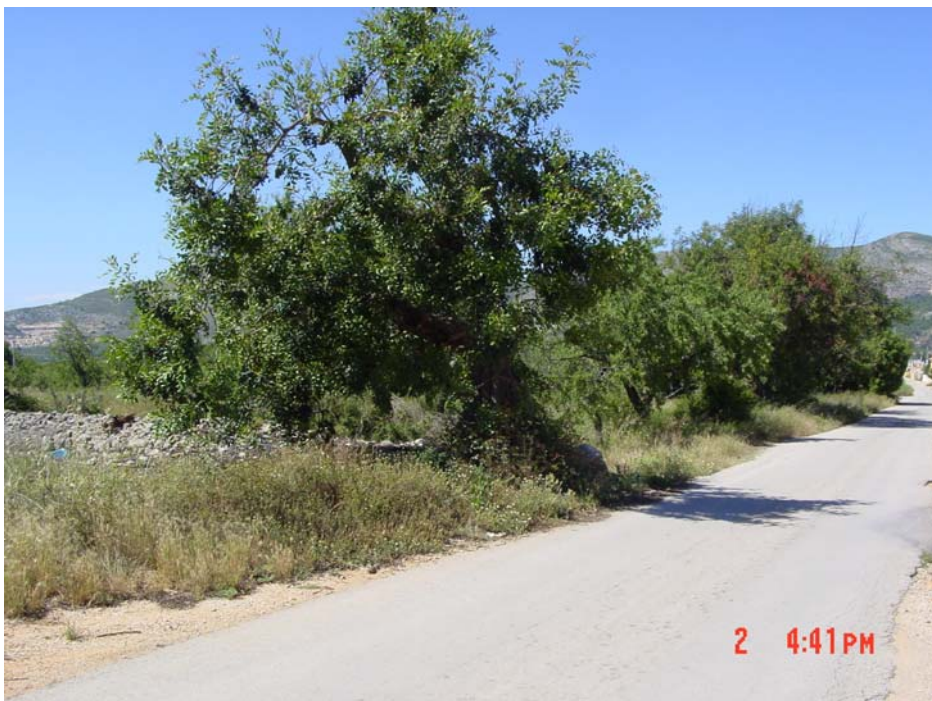
Un algarrobo, porte mediano, mal estado .....2.000 €