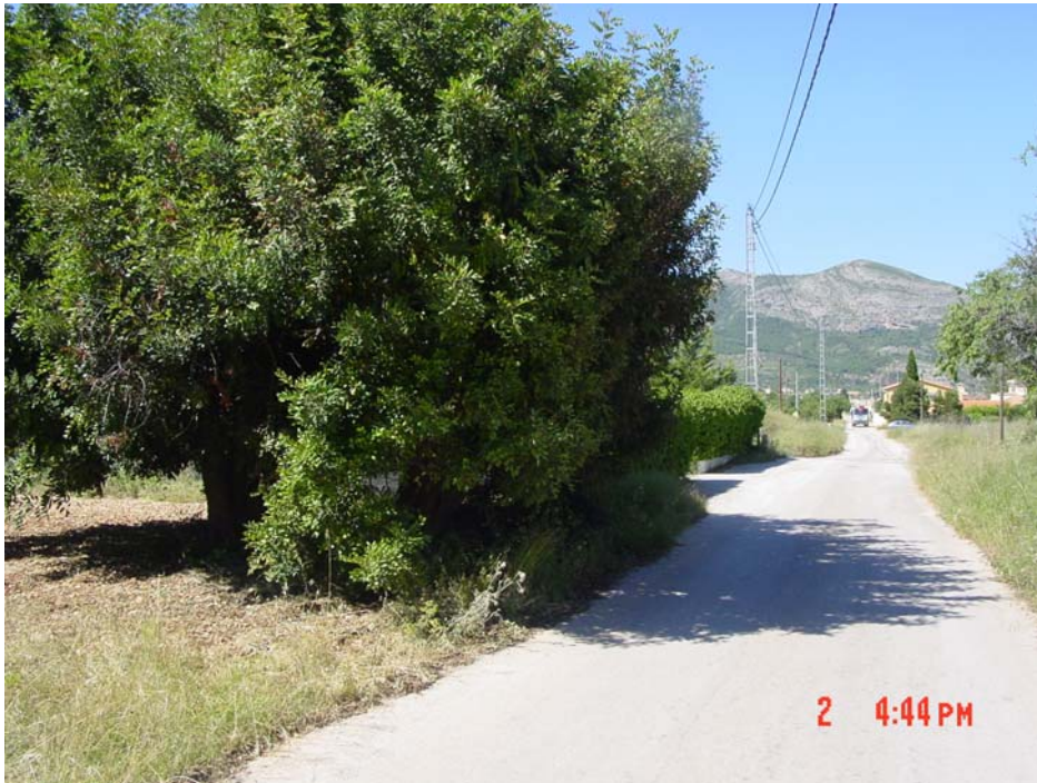
Un algarrobo, gran porte, buen estado .....4.000 €